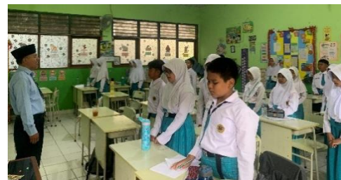
Gambar 2. Pembiasaan Menyanyikan Lagu Indonesia Raya

Dengan demikian, internalisasi cinta tanah air tidak terjadi secara instan, melainkan melalui proses pembiasaan yang membentuk kebiasaan, sikap, dan kecenderungan bertindak peserta didik secara bertahap dan berkelanjutan.